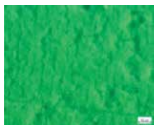
Polystone P copolymer UV